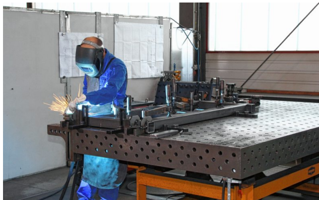
Am Firmensitz in Kolbermoor gibt es zwar keine große Produktion, jedoch eine Prototypenfertigung.

Rosenheim – Jede Menge Fachwissen, ein hohes Maß an Kreativität, eine gesunde Portion Mut sowie unermüdlicher Arbeitseinsatz sind gefragt, wenn Bürger vorhaben, ein eigenes Unternehmen zu gründen. Vom Businessplan bis zu steuerlichen Aspekten gibt es vor der Gründung allerhand zu bedenken. Um Menschen beim Sprung in die Selbstständigkeit unter die Arme zu greifen, hat die IHK für München und Oberbayern regelmäßige Beratungstermine ins Leben gerufen. So steht der nächste Sprechtag in Rosenheim am Mittwoch, 6. September, an. IHK-Gründungsberatung wird dann in der Geschäftsstelle an der Hechtseestraße Fragen zur Gründung beantworten sowie Tipps geben. Anmeldungen sind online unter www.gruenden-in-oberbayern.de sowie telefonisch unter 080 31 / 230 81 20 möglich.